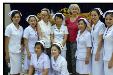
Les infirmières Lao - mission mai - juin 2013