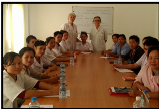
Infirmières, médecins et Internes à Luang Prabang

Nous avons constaté un bon taux de fréquentation variant de 8 à 26 personnes et un bon investissement des participants comprenant des Infirmières Diplômées d'Etat (IDE), des Elèves, des Internes, des Cadres et des Médecins.