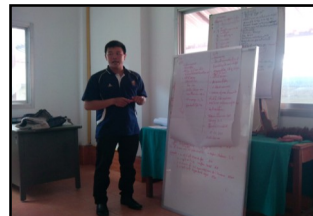
IDE militaire à Vientiane « au rapport »

Nous avons noté de bonnes connaissances et une maîtrise des pratiques spécifiques (Diplôme d'Etat en 3 ans), mais une absence quasi-systématique des règles d'hygiène et de sécurité. Tout ce qui est considéré comme « rôle de l'IDE » est systématiquement délégué aux familles. Il manque le maillon « aide-soignante » dans la chaîne des soins.